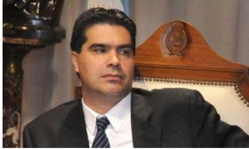
Capitanich se ubica entre los gobernadores peor evaluados del país, considerando únicamente la imagen negativa de su gestión.

Se trata de un estudio de opinión realizado por DATAMATICA abarcando las 23 provincias argentinas más Capital Federal. La muestra se terminó de recolectar el 30 de noviembre de 2009 y consta de 4125 casos efectivos distribuidos en 80 localidades.