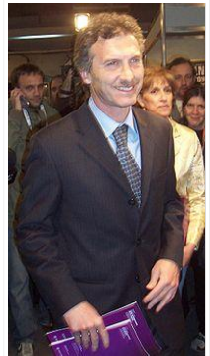
Mauricio Macri inaugurando la Feria Internacional de Música en 2008.

El 26 de septiembre de 2009 se dió a conocer que el gobierno de Mauricio Macri tenía una deuda de $36.000.000 debido a la falta de pago de las remuneraciones de unos 1700 agentes de policía solicitados por la Ciudad de Buenos Aires al gobierno nacional para custodiar edificios y funcionarios públicos. 23 Finalmente, el 3 de noviembre, tras una reunión celebrada en la Casa de Gobierno entre el ministro de Justicia, Seguridad y Derechos Humanos Aníbal Fernández, su homólogo porteño Guillermo Montenegro y el Jefe de Gabinete del Gobierno de la Ciudad de Buenos Aires, Horacio Rodríguez Larreta, se llegó a un acuerdo por el cual la Ciudad de Buenos Aires canceló la deuda. En esa ocasión las autoridades porteñas sostuvieron que no pagarían más dinero a los efectivos federales por la seguridad en espacios públicos, como parques, porque considera que es parte de la tarea que desempeña la Policía Federal Argentina en el distrito. En cambio, el gobierno porteño reconsideraría la presencia de efectivos para el cuidado de hospitales y otros edificios públicos. 24