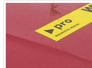
Etiqueta de la alianza electoral Propuesta Republicana (PRO), formada a raíz de un acuerdo entre Macri y Ricardo López Murphy, del partido Recrear para el Crecimiento.